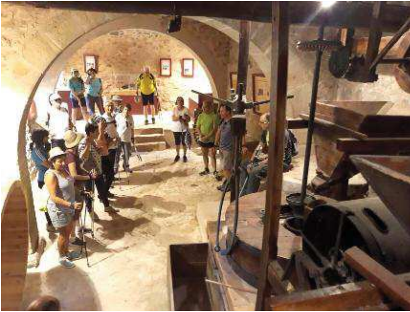
Los grupos pueden acceder al interior de los espacios recuperados, como el molino de la imagen