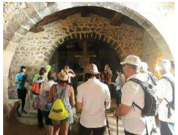
En el interior de un templo durante el recorrido guiado

grupos pequeños propicia el contacto con los habitantes.