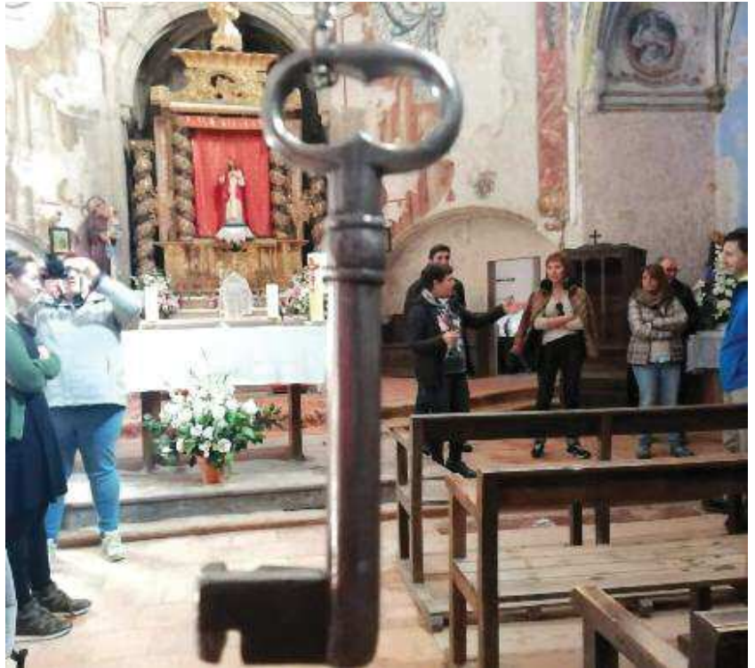
Las visitas son para grupos reducidos y son los clientes los que eligen el horario y el recorrido